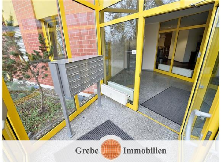
Windfang mit Briefkastenanlage