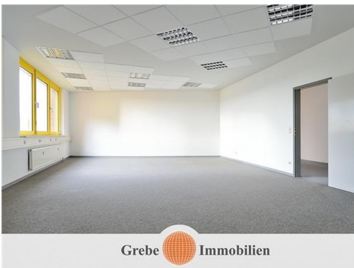
Zimmer Bsp. 1 im 1. OG