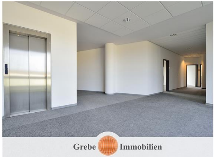
Freie Büroetage 1. OG