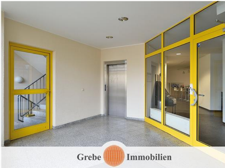
Vorraum zum Treppenhaus