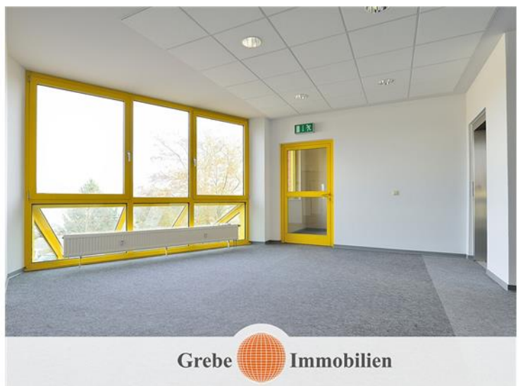
Zimmer Bsp. 2 im 1. OG